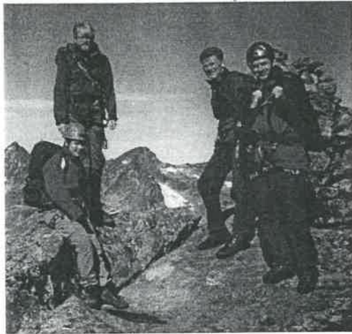
Folk og fe på tur