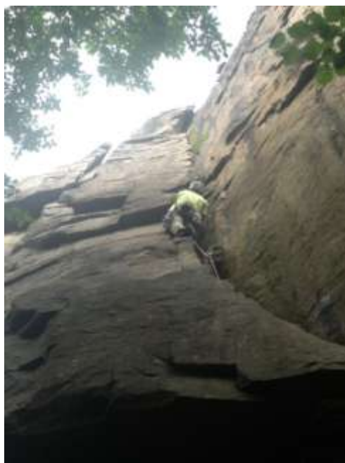
Rute 8 Taukutter'n over.